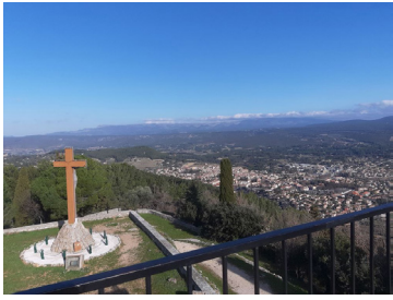
vue sur Le Beausset