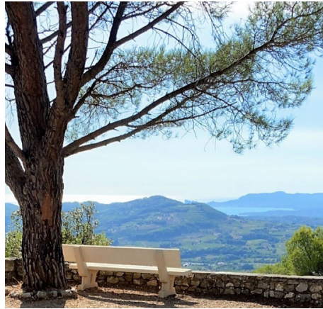
vue sur la baie de La Ciotat