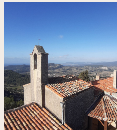
chapelle Notre-Dame du Beausset-Vieux

de l'entretien et de l'accueil du public du site.